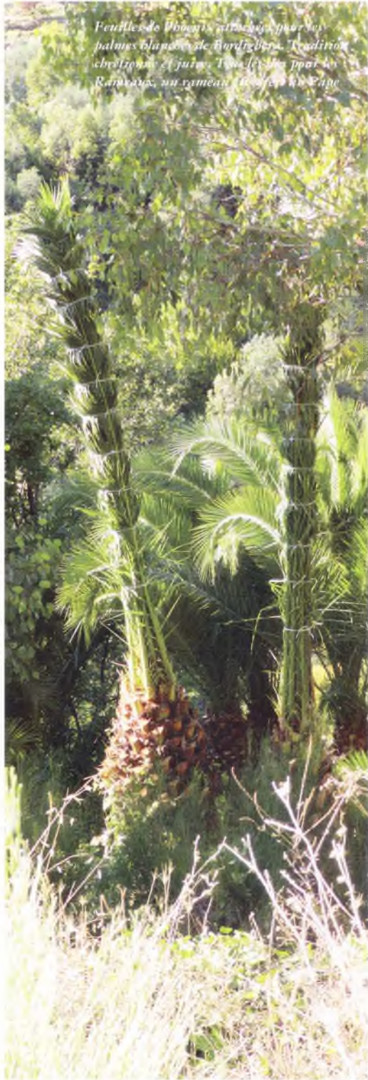
Feuilles de Phoenix canariensis pour ses palmes blanches de Bordighera. Tradition chrétienne et juive. Travail des pays de Ramonada, au rameau de l'île de Lanzarote